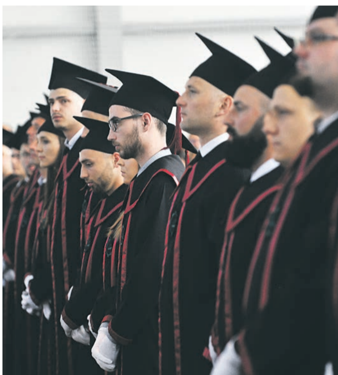
Sikeres, motivált fiatalok veszik át diplomájukat a Neumann János Egyetemen