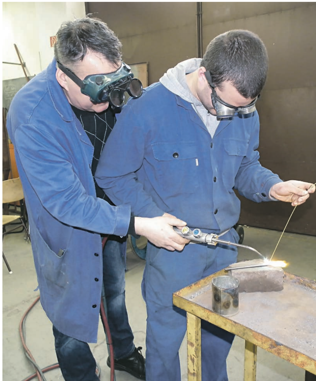
A hegesztést nem lehet online megtanulni

A válság a turizmus-vendéglátás ágazatot padlóra kényszerítette. Egyebek mellett erről is szó esett egy másik, az ágazat helyzetét érintő online konferencián. Itt ismert szakemberek festették le a közel sem biztató helyzetet. Ganczer Gábor, a Hungexpo Zrt. vezérigazgatója, a Magyarországi Rendezvény-szervezők és –szolgáltatók Szövetségének az elnöke azt mondta, hogy a szállodai, a vendéglátóipari, az utazási és a rendezvény-szervező terület