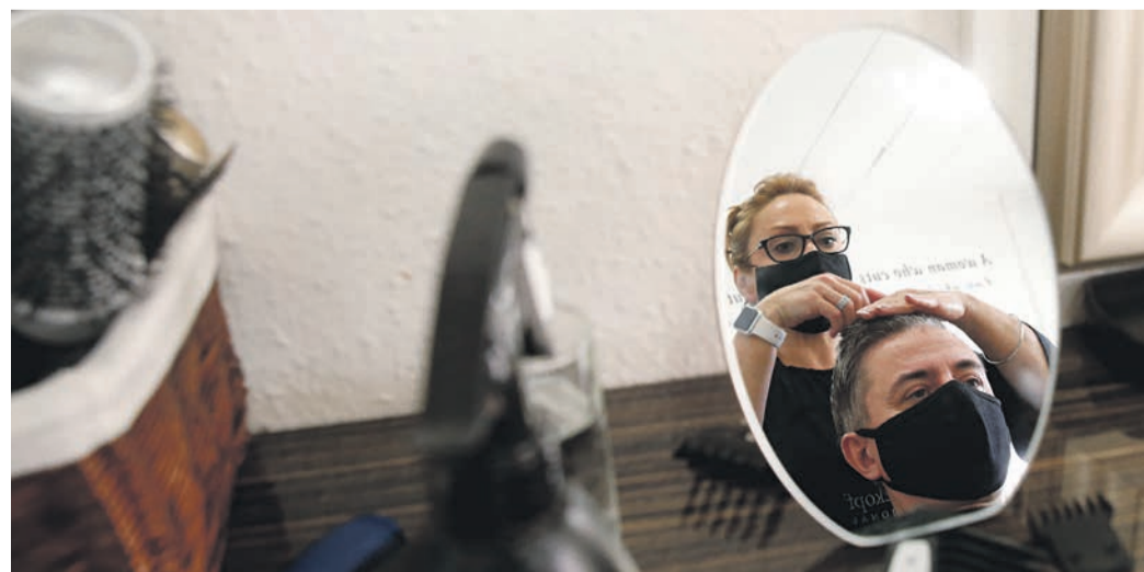
Három év türelmi idő után kell törleszteni a kölcsönt

A válság által közvetlenül érintett ágazatokban tevékenykedő mikro-, kis- és középvállalkozások számára 2021. márciusától érhető el a Kamatmentes Újrindítási Gyorskölcsönt országsszerte az MFB Pontokon, hogy a vállalkozások a székhelyükhöz legközelebb